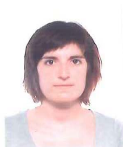
Maite Etcheto Foreign Rights COMBEL EDITORIAL www.combeleditorial.com

Iniciar a les pimes catalanes a la internacionalització. Col·laborant amb Apic en la promoció internacional de l'associació, per fer conèixer i promoure els il·lustradors a nivell internacional.